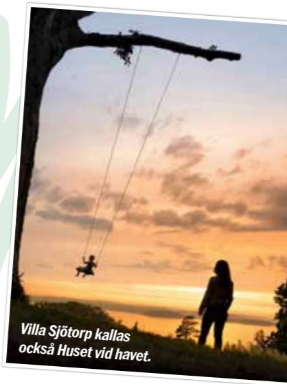
Villa Sjötorp kallas också Huset vid havet.

En annan pärla är Strandflickornas havshotell i Lysekil. Det ligger egentligen utspritt över flera hus, där Gula Villan är min favorit. Paviljongen nere på bryggan vid namn Havsateljen med egen jacuzzi är makalös. Antika mattor blandas med gröna växter och hängmattor i en cool mix.