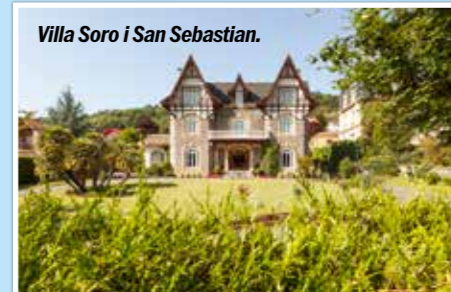
Villa Soro i San Sebastian.

1. Spana in nya Villa Soro i chica Barrio de Gros nära lyxiga restauranger som Arzak, Mugaritz och