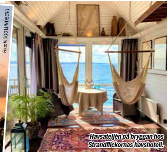
Havsateljen på bryggan hos Strandflickornas havshotell.