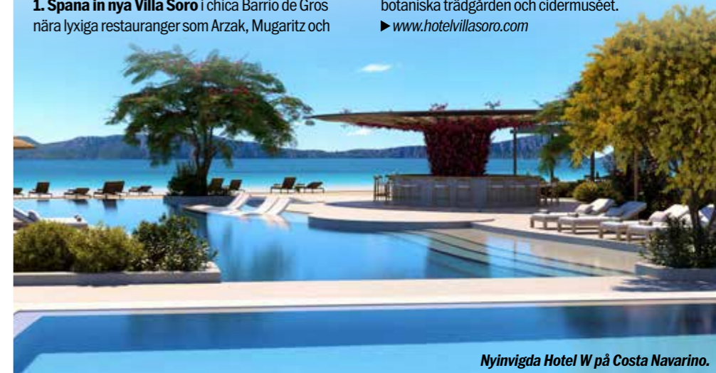
Nyinvigda Hotel W på Costa Navarino.